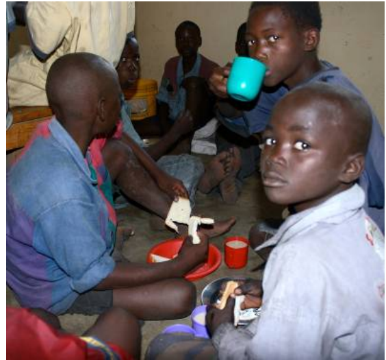
Straatkinderen in de Dagopvang

Kinderen die verslaafd zijn, aan middelen zoals drugs of alcohol, worden behandeld en krijgen medische zorg en goede voeding, zodat hun lichamelijke conditie verbetert. Ze kunnen in deze periode alvast wennen aan een geregeld leven. Het aanleren van basisvaardigheden zoals lezen, schrijven, rekenen en hygiëne is in deze periode een van de andere belangrijke doelen. Het kind zal hierna naar verwachting deel gaan nemen aan het reguliere basisonderwijs.