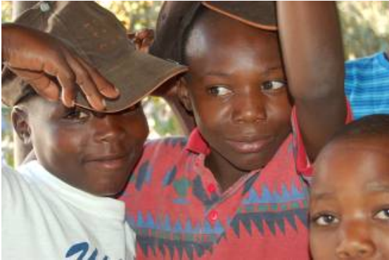
Jongens van Malimbe Family

We zijn begonnen met de bouw van weer twee slaaphuisjes voor de kinderen. Alle kinderen hebben ieder 50 stenen op hun hoofd naar de bouwplek gebracht. Als de huisjes klaar zijn kunnen we alle 50 kinderen een ruime plek bieden om te slapen. Rest ons nog een stafhuis en kantoor te bouwen.