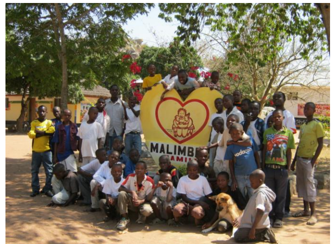
De kinderen van Malimbe Family

Malimbe Family, voor de 54 kinderen die (nog) niet naar huis kunnen, is als gezinsvervangend tehuis gericht op het geven van begeleiding, opvoeding, onderwijs en last but not least liefde en geborgenheid. Uiteindelijk willen we de voormalige straatkinderen de kans bieden om volwaardige staatsburgers te worden, die in hun eigen onderhoud kunnen voorzien.