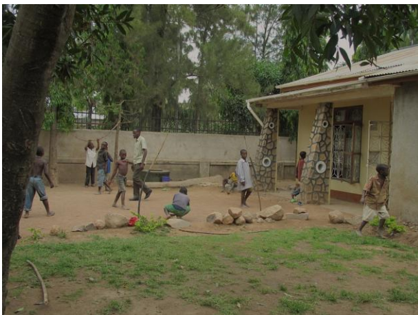
De jongens aan het spelen bij het Back Home House

Ons werk in Mwanza, het werk op straat, de opvang in het Back Home House, de hereniging met de families en het bieden van een vervangende thuissituatie in Malimbe Family, gaat helaas nog steeds gewoon door. Helaas, want we zien liever dat ons werk overbodig wordt. Maar als onze straatteams 2 keer per week de kinderen gaan opzoeken in de stad, hetzij 's nachts, hetzij overdag, dan treffen ze alleen maar meer kinderen op straat aan en steeds jonger. Een onderzoek van de Railway Children of Africa, een internationale organisatie eveneens actief in de opvang van kwetsbare kinderen, toonde aan, dat er eind 2012 circa 1850 kinderen op straat leefden. Dat waren er in 2008 nog rond de 400. Zij houden zich in leven met bedelen, kleine karweitjes en stelen. En als de overlast te groot wordt, dan grijpt de politie in, zoals laatst in oktober. Met een grote razzia joegen ze alle kinderen van de straat. Er werden 15 jongens door de politie bij het Back Home House (BHH) afgezet.