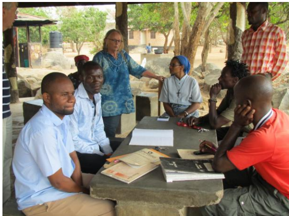
Het team tijdens het werkoverleg